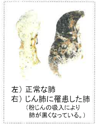
左) 正常な肺 右) じん肺に罹患した肺 (粉じんの吸入により肺が黒くなっている。)

現在、じん肺を治す根本的な治療がないため、じん肺にかからないための措置として、粉じんの発生源対策、局所排気装置等の適正な稼働、呼吸用保護具の適正な着用などにより、粉じんへの「ばく露防止対策」を徹底することが重要です。