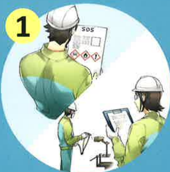
SDS及び作業現場の確認

これまで以上に事業者の主体的な取組が求められます ラベル・SDSの伝達やリスクアセスメントの実施がこれまで以上に重要になります