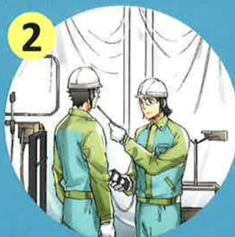
リスクアセスメントの実施