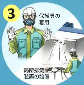
リスク低減措置の実施