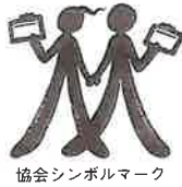
協会シンボルマーク