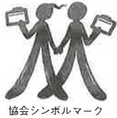
協会シンボルマーク